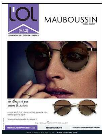
Le dernier numéro de L'OL MAG